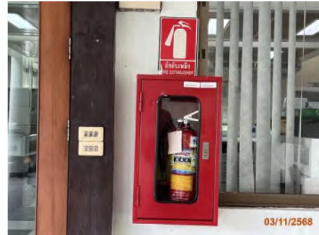
ภาพที่ 2.2-33 สัญญาณแจ้งเหตุเพลิงไหม้ และถังดับเพลิงชนิดเคมีบริเวณอาคารบริหารท่าเรือแหลมฉบัง