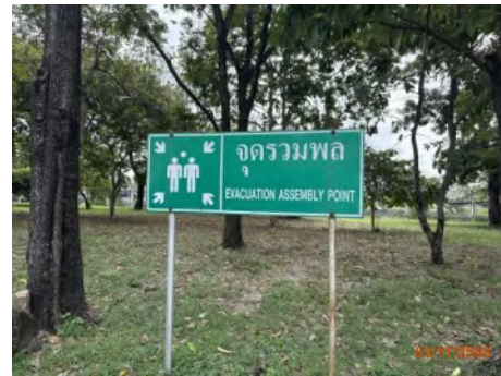
ภาพที่ 2.2-32 ป้ายจุดรวมพลในบริเวณท่าเรือแหลมฉบัง