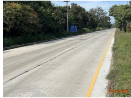
ภาพที่ 2.2-1 เส้นทางเข้าท่าเรือแหลมฉบัง