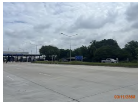
ภาพที่ 2.2-14 สภาพเส้นทางในเขตท่าเรือแหลมฉบัง