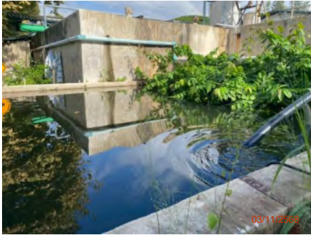
ภาพที่ 2.2-4 ระบบบำบัดน้ำเสีย ท่าเรือแหลมฉบัง ชั้นที่ 1