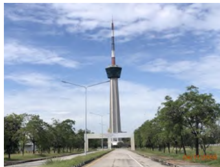
ภาพที่ 2.2-20 หอบังคับการพัฒนาแหลมฉบัง