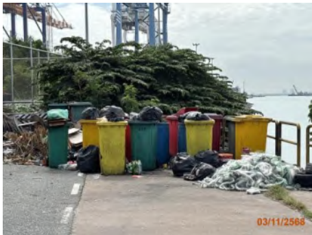
ภาพที่ 2.2-6 ถังขยะบริเวณท่าเทียบเรือ