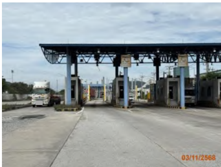
ประตูตรวจสอบสินค้า 1