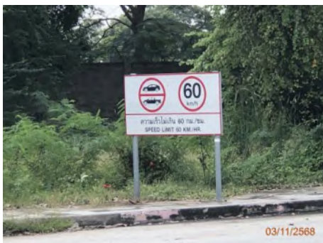
ภาพที่ 2.2-9 ป้ายจำกัดความเร็วของรถภายในท่าเรือแหลมฉบัง