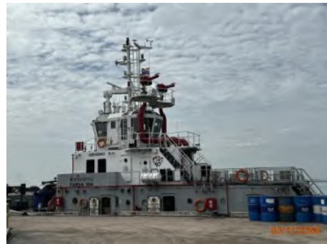
ภาพที่ 2.2-7 เรือที่จอดบริเวณท่าเทียบเรือบริการ ท่าเรือแหลมฉบัง