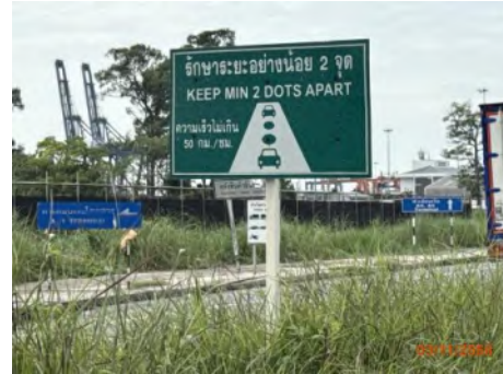
ภาพที่ 2.2-12 (ต่อ) ป้ายเครื่องหมายและป้ายสัญลักษณ์ด้านการจราจรในเขตท่าเรือแหลมฉบัง