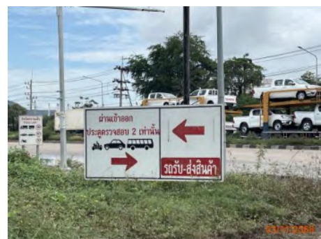
ภาพที่ 2.2-12 ป้ายเครื่องหมายและป้ายสัญลักษณ์ด้านการจราจรในเขตท่าเรือแหลมฉบัง