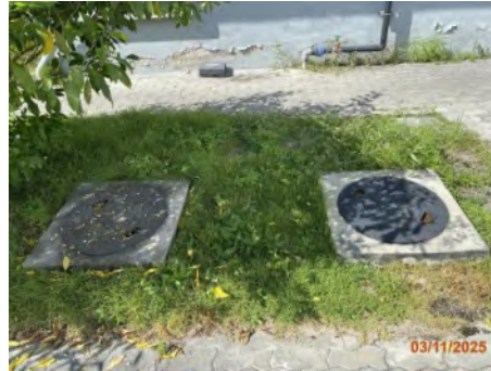
ภาพที่ 2.2-36 Septic Tank ที่อาคารสำนักงานท่าเรือ