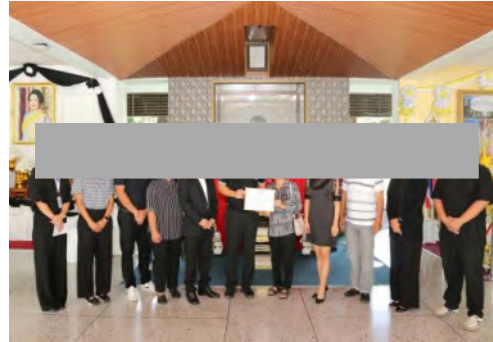
โครงการประเพณีเกี่ยวข้าว เทศบาลนครแหลมฉบัง เมื่อวันที่ 11 พฤศจิกายน 2568 จำนวน 40,000 บาท