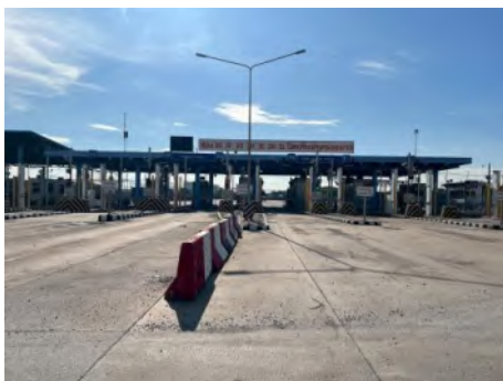
ประตูตรวจสอบสินค้า 3