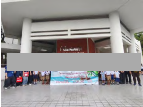
โครงการมอบโอกาสทางการศึกษาพัฒนาคนดีลูกน้ำเค็ม เมื่อวันที่ 9 กันยายน 2568 จำนวน 1,145,000 บาท