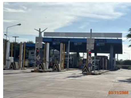
ประตูตรวจสอบสินค้า 4