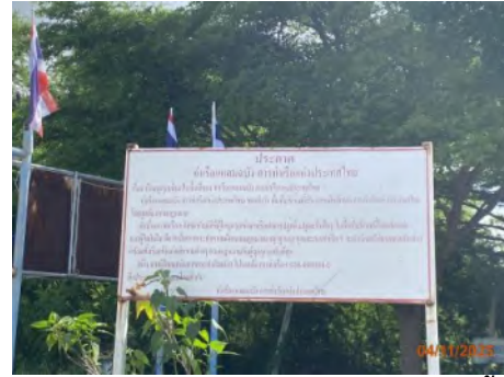
ภาพที่ 2.2-11 ป้ายประกาศ เรื่อง การบุกรุกพื้นที่