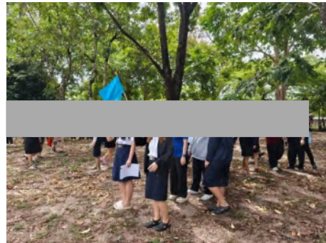
ภาพที่ 2.2-30 การฝึกซ้อมดับเพลิงและซ้อมอพยพหนีไฟปลอดภัย ประจำปีงบประมาณ 2568