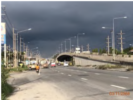
สะพานข้ามแยกแหลมฉบัง