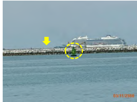
แนวเขื่อนกันคลื่น และทุ่นลอย