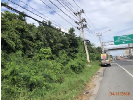
ภาพที่ 2.2-10 พื้นที่ปลูกไม้ยืนต้นบริเวณ ริมทางหลวงหมายเลข 3