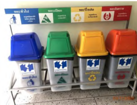
ภาพที่ 2.2-22 ถังขยะแยกประเภทภายในพื้นที่ ทลจ.