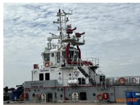
ภาพที่ 2.2-35 อุปกรณ์ดับเพลิงประจำเรือ