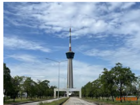
ภาพที่ 2.2-2 พื้นที่สีเขียวในบริเวณท่าเรือแหลมฉบัง