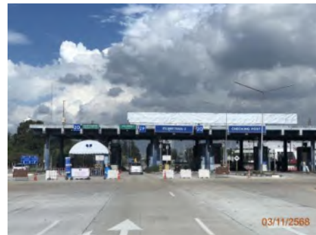
ประตูตรวจสอบสินค้า 2