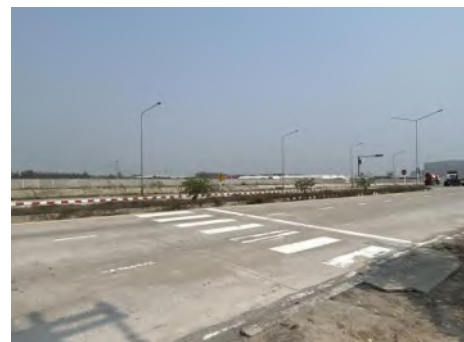
ภาพที่ 2.2-29 มาตรการด้านความปลอดภัยแก่ผู้ใช้งานภายในท่าเรือแหลมฉบัง