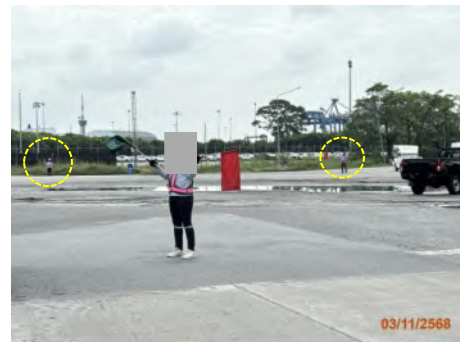
ภาพที่ 2.2-13 เจ้าหน้าที่ประจำบริเวณพื้นที่เสี่ยง