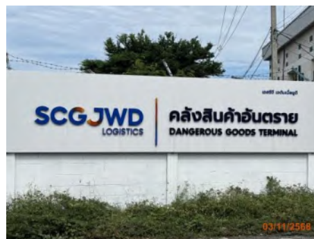
ภาพที่ 2.2-34 คลังสินค้าอันตราย ท่าเรือแหลมฉบัง