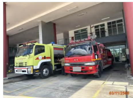
ภาพที่ 2.2-28 ศูนย์ป้องกันและบรรเทาสาธารณภัย ท่าเรือแหลมฉบัง และรถดับเพลิง