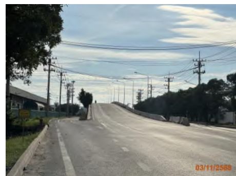
สะพานข้ามแยก Unithai