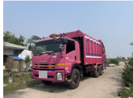
ภาพที่ 2.2-23 รถเก็บขนขยะมูลฝอย