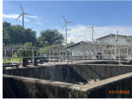
ภาพที่ 2.2-5 ระบบบำบัดน้ำเสีย ท่าเรือแหลมฉบัง ชั้นที่ 2