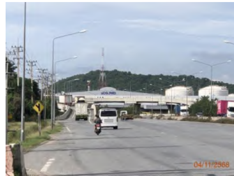
สะพานกลับรถ