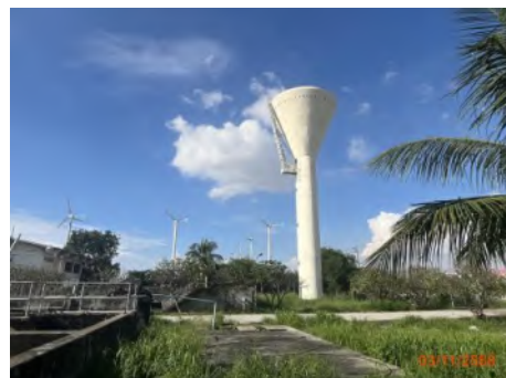
ภาพที่ 2.2-21 ถังเก็บน้ำสำรองบริเวณท่าเรือแหลมฉบัง