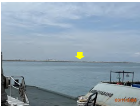
ภาพที่ 2.2-8 แนวเขื่อนกันคลื่น