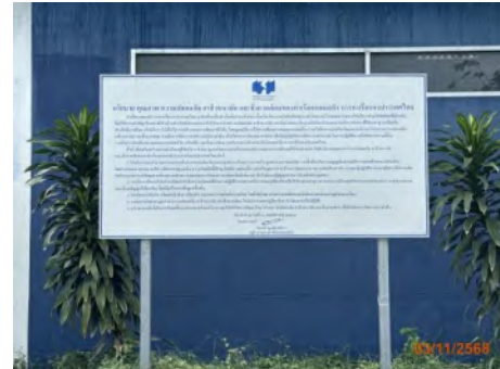
ภาพที่ 2.2-37 ป้ายรณรงค์ด้านอาชีวอนามัยและความปลอดภัยภายในท่าเรือแหลมฉบัง