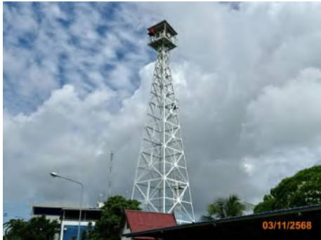
กระโจมไฟบริเวณท่าเทียบเรือบริการ