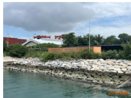
ภาพที่ 2.2-3 แนว Revetment บริเวณท่าเรือแหลมฉบัง