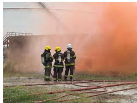
ภาพที่ 2.2-31 การฝึกอบรมเชิงปฏิบัติการและการฝึกซ้อมแผนรักษาความปลอดภัย ครั้งที่ 2 ปี 2568 ระหว่างวันที่ 18-22 สิงหาคม 2568