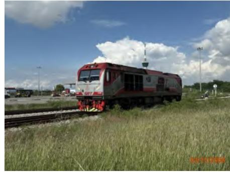
ภาพที่ 2.2-18 พื้นที่ศูนย์การขนส่งตู้สินค้าทางรถไฟ (SRTO)