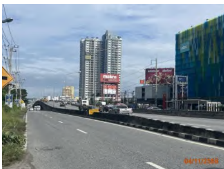
สะพานกลับรถ/สะพานข้ามแยกทางเข้านิคมฯ